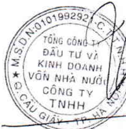
Nguyễn Chí Thành